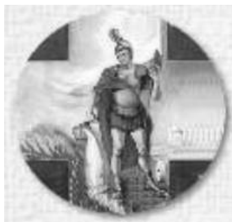
Św. Florian patron strażaków.

Niech to spojrzenie na św. Floriana patrona strażaków i te kilka myśli posłużą duchowemu rozwojowi, nie tylko kasparuskich strażaków ale i wszystkich druhów w strażackich mundurach.